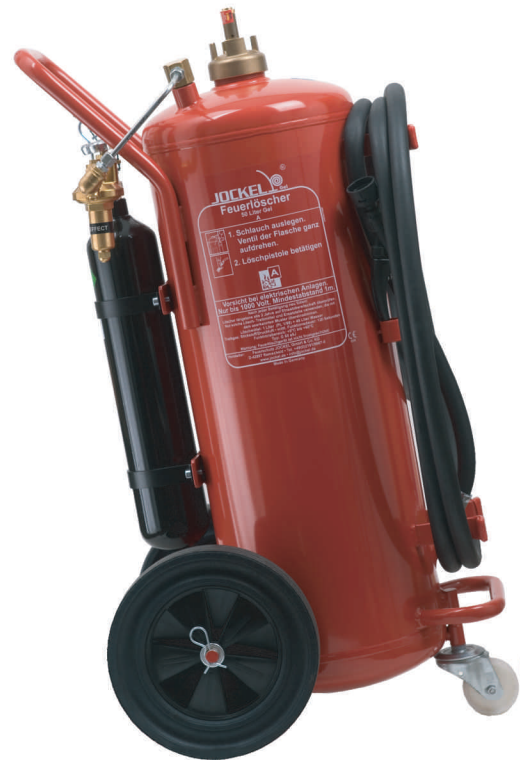
Gellöcher Auflade G 50 AJ Gel