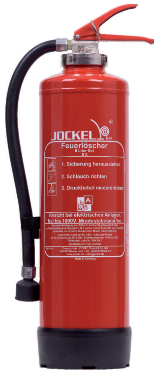
Gellöcher Dauerdruck/Hebel G 6 HDJ Gel