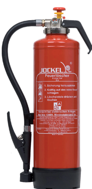
Gellöcher Dauerdruck/Schlagknopf G 6 SDJ